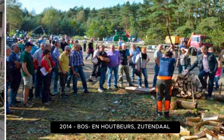
2014 - BOS- EN HOUTBEURS, ZUTENDAAL