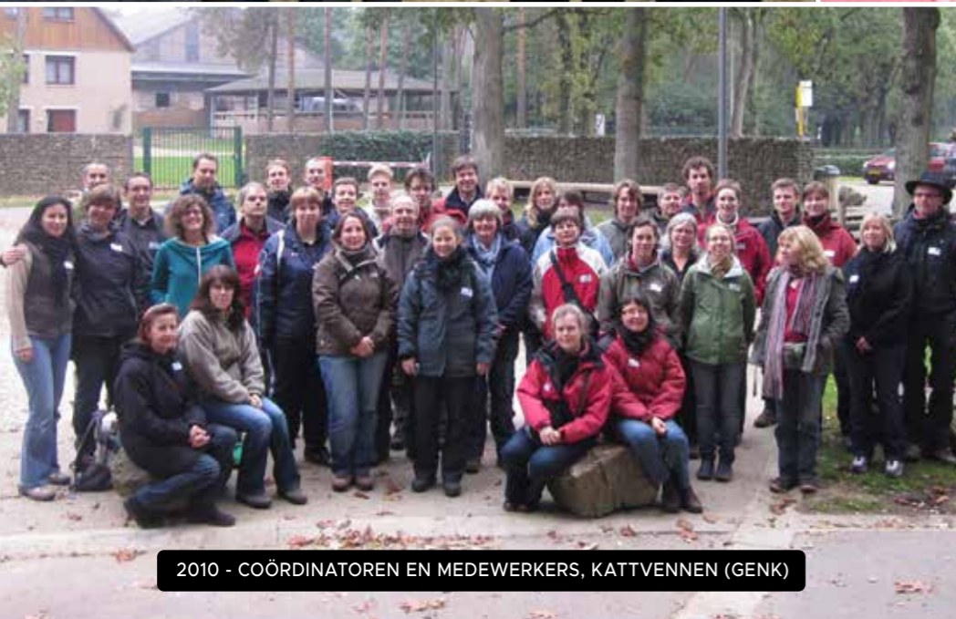
2010 - COÖRDINATOREN EN MEDEWERKERS, KATTVENNEN (GENK)