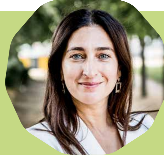
Zuhail Demir Vlaams minister van Omgeving

Wij legden Vlaams minister van Omgeving Zuhail Demir en de gedeputeerden van de verschillende provincies telkens twee vragen voor: wat is voor jou de meerwaarde van De Bosgroepen, en wat wens je hen in de toekomst?