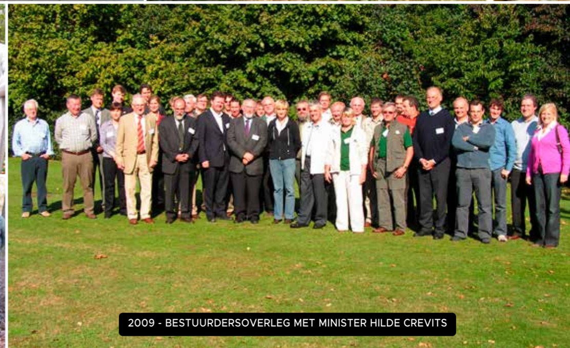
2009 - BESTUURDERSOVERLEG MET MINISTER HILDE CREVITS