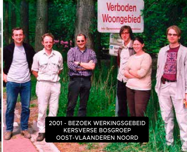
2001 - BEZOEK WERKINGSGEBEID KERSVERSE BOSGROEP OOST-VLAANDEREN NOORD