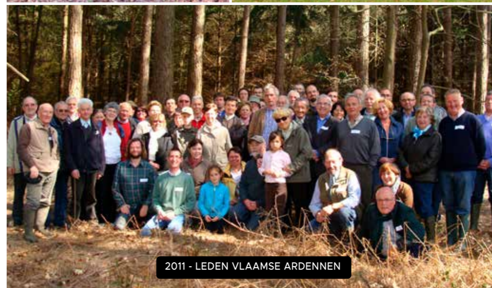
2011 - LEDEN VLAAMSE ARDENNEN