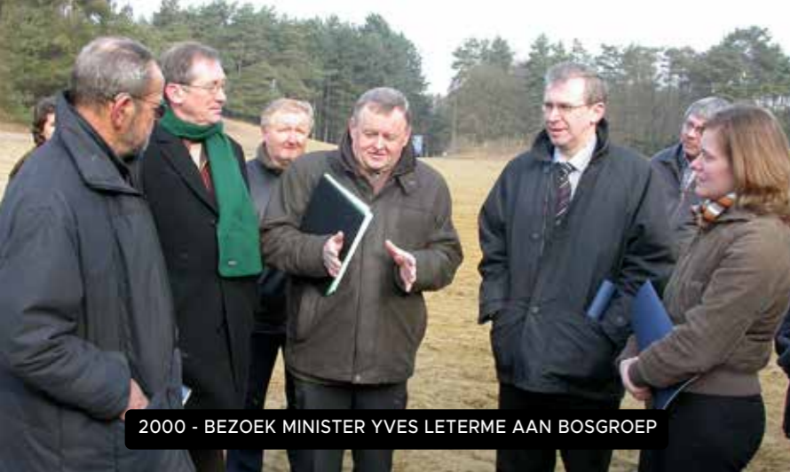
2000 - BEZOEK MINISTER YVES LETERME AAN BOSGROEP