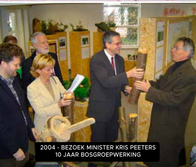
2004 - BEZOEK MINISTER KRIS PEETERS 10 JAAR BOSGROEPWERKING