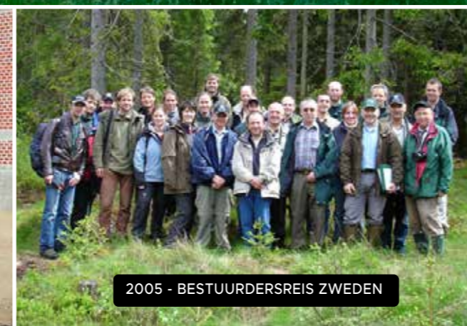
2005 - BESTUURDERSREIS ZWEDEN