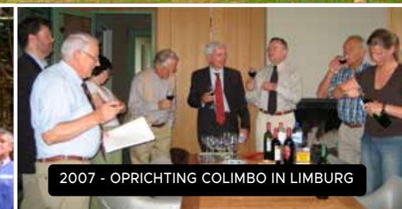
2007 - OPRICHTING COLIMBO IN LIMBURG