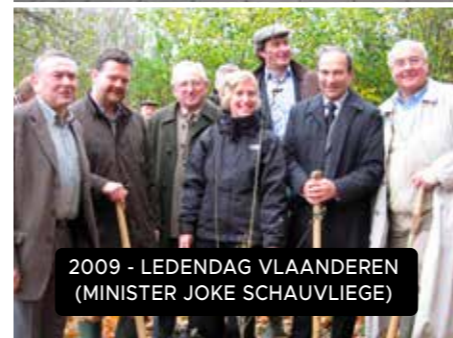
2009 - LEDENDAG VLAANDEREN (MINISTER JOKE SCHAUVLIEGE)