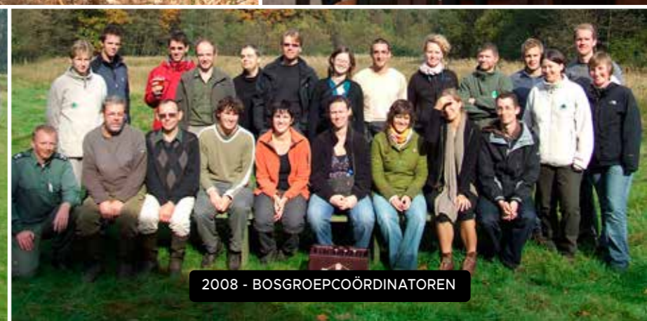
2008 - BOSGROEPCOÖRDINATOREN