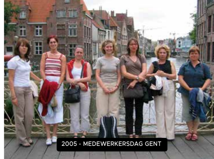
2005 - MEDEWERKERSDAG GENT