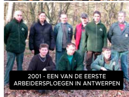
2001 - EEN VAN DE EERSTE ARBEIDERSPLOEGEN IN ANTWERPEN