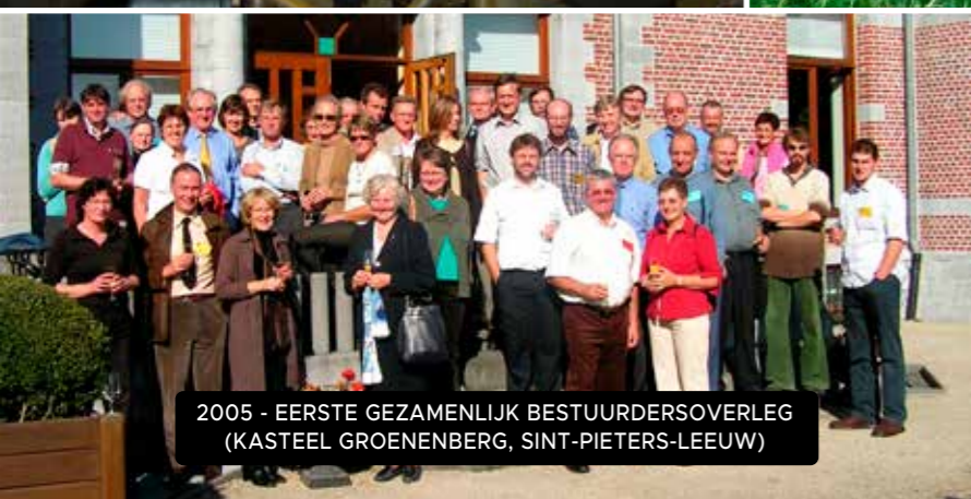
2005 - EERSTE GEZAMENLIJK BESTUURDERSOVERLEG (KASTEEL GROENENBERG, SINT-PIETERS-LEEUV)