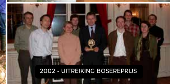
2002 - UITREIKING BOSEREPRISJ