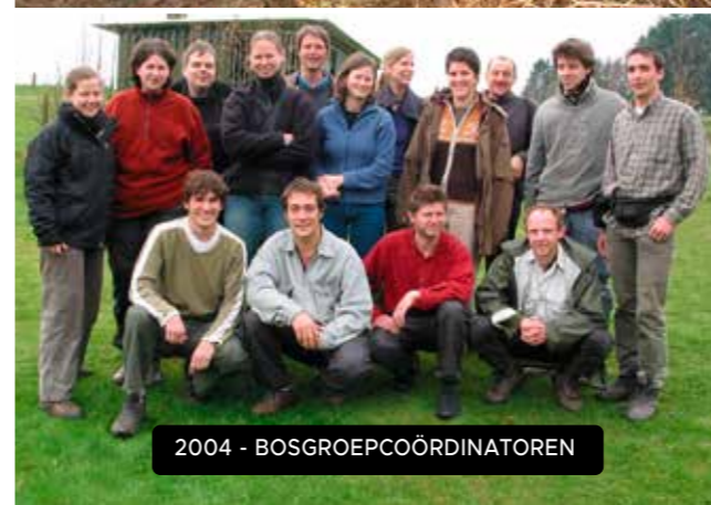
2004 - BOSGROEPCOÖRDINATOREN